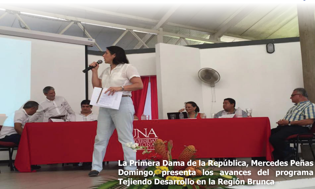
La Primera Dama de la República, Mercedes Peñas Domingo, presenta los avances del programa Tejiendo Desarrollo en la Región Brunca