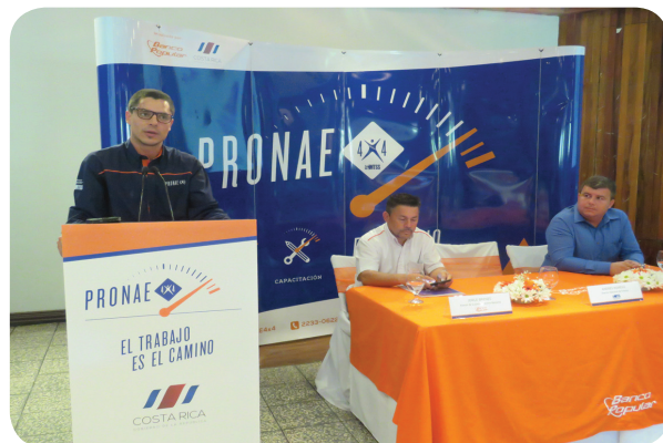
Andrés Romero, Director Nacional de Empleo

El Programa Nacional de Empleo (PRONAE 4X4) del Ministerio de Trabajo y Seguridad, impulsado por el Banco Popular, es una herramienta que promueve el desarrollo de las comunidades y las personas, mediante apoyo económico temporal (transferencias condicionadas).