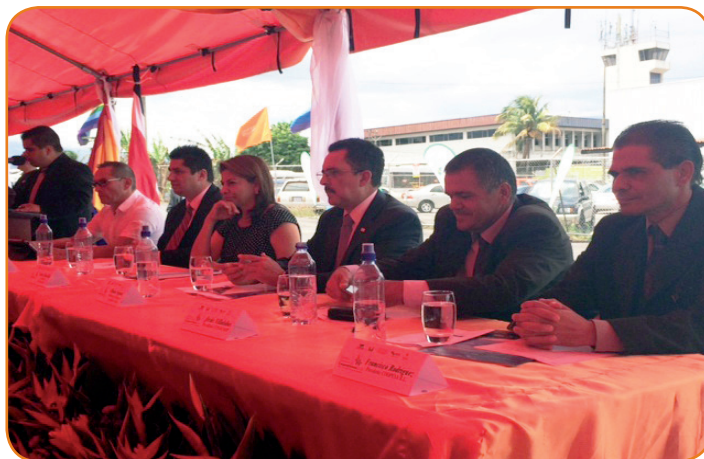
La Presidenta de la República, Laura Chinchilla Miranda, el Ministro de Trabajo y Seguridad Social, Olman Segura Bonilla, como rector del sector cooperativo del país, fueron parte de la Semana Nacional del Cooperativismo.

ejemplo que significa COOPESA para la clase trabajadora del país.