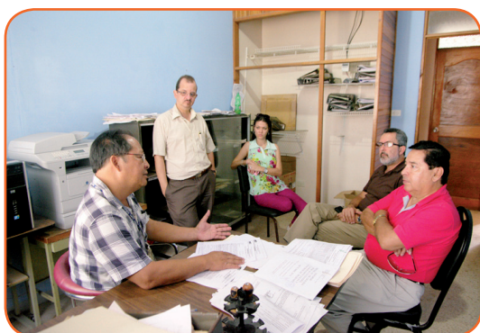
Oficina Cantonal de Cañas