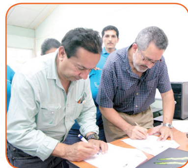
Olman Segura, Ministro de Trabajo, y Jorge Chavarría, Alcalde de Santa Cruz, firman la apertura de la ventanilla EMPLEATE

El Ministro Segura felicitó a los jóvenes por ser los pioneros de la estrategia EMPLEATE en la zona de Santa Cruz y los instó a seguir estudiando con la misma ilusión para mejorar su calidad de vida.