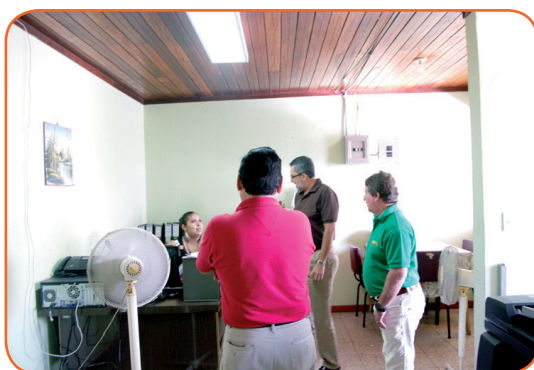
Oficina Cantonal de Liberia