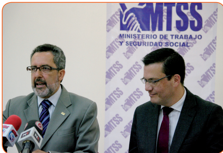
El Ministro de Trabajo y Seguridad Social, Olman Segura y el Viceministro de Gobernación, Freddy Montero, anunciaron la apertura de un régimen especial para facilitar la documentación migratoria a las personas extranjeras que laboran en el país, especialmente a quienes se desempeñan en los sectores agrícola, doméstico y de la construcción.

Freddy Montero Mora, Viceministro de Gobernación, recordó que “se busca proteger los derechos fundamentales de los