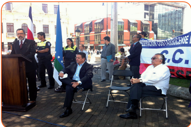
El Ministro de Trabajo y Seguridad Social, Olman Segura, recalcó el compromiso del MTSS de velar por el cumplimiento de los derechos laborales de todos y todas las trabajadoras del país.

La escultura, fabricada en bronce, muestra a un agricultor con el torso desnudo, pantalón de mezclilla, botas de hule y un mazo en una de sus manos.