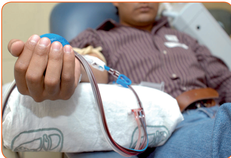
La Unidad Servicios de Bienestar Social del MTSS realizará este miércoles 3 de abril, de 8 am a 11 am, una jornada de donación de sangre a la que espera asistan muchas de las personas funcionarias de la institución.

“Ya no es necesario llegar en ayunas, lo importante es que si la persona tiene lípidos altos en sangre como triglicéridos altos y colesterol alto, en la muestra de sangre que se toma antes de hacer la donación, este problema puede ser de-