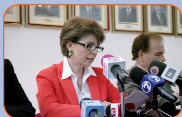
La Ministra de Trabajo, Sandra Piszcz presentó la propuesta del Gobierno ante el CNS.