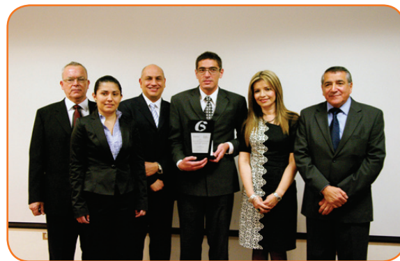
Los jefes del MTSS mostraron su alegría al recibir el reconocimiento a la Gestión Pública.

"Para el Ministerio de Trabajo resulta muy halagador hacerse meritorio del Reconocimiento a Prácticas Promisorias en la Gestión Pública en su II Edición, ya