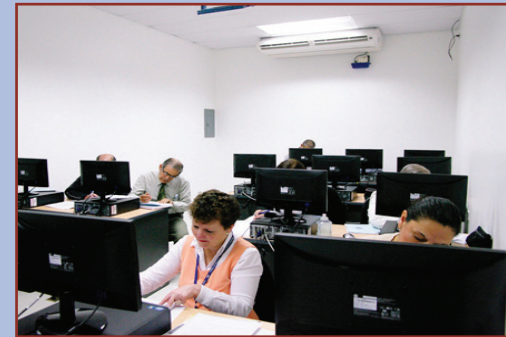
24 funcionarios y funcionarias se capacitarán en este nuevo Laboratorio de Cómputo

Esta actividad permitirá a quienes conozcan dichas herramientas, pero que no han recibido cursos formalmente, adquirir el conocimiento suficiente para que puedan obtener la acreditación en cada una de las herramientas