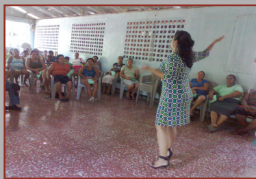
Un total de 715 mujeres jefas de hogar fueron capacitadas en la Dirección Regional Pacífico Central del Ministerio de Trabajo.

La Dirección Regional Pacífico Central del Ministerio de Trabajo y Seguridad Social ha capacitado, en lo que va del año, a 715 mujeres jefas de hogar mediante charlas de derecho laboral.