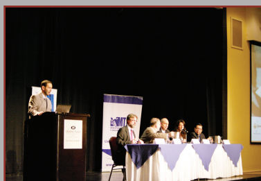
Expertos internacionales y autoridades del MTSS fueron parte del Seminario Internacional.

Costa Rica realizaron el Seminario Internacional: Reflexiones en torno al Salario Mínimo.