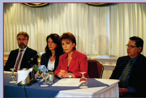
La ministra de Trabajo, Sandra Piszcz, presentó a la prensa los resultados de la Campaña de Salario Mínimo. La acompañan Jorge Abrahao, del IPEA de Brasil, Luiza Carvalho, Coordinadora Residente del Sistema de las Naciones Unidas y Rodrigo Acuña, Director Nacional de Inspección.

A partir del tamaño de las empresas - micro (1-5); pequeña (6 a 30); mediana (31 a 100) y grande (más de 100)- se ha podido determinar que el porcentaje de infraccionalidad desciende a medida que aumenta el tamaño del establecimiento (43.7%, 42.0%, 34.3% y 30.8% respectivamente).