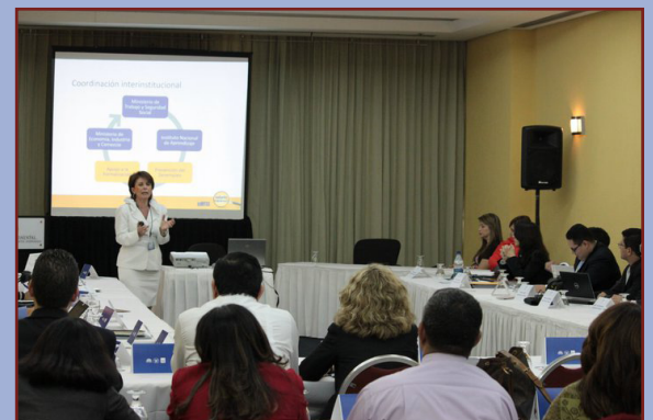
La Ministra de Trabajo Sandra Pizsk, en su participación en el Seminario Regional en República Dominicana.

comunicación estratégica y el diálogo social aplicadas a la focalización de las inspecciones. Posterior al evento, los participantes en el mismo socializaron las experiencias e iniciativas de cada país para elaborar y ejecutar estrategias de focalización de las inspecciones de trabajo.