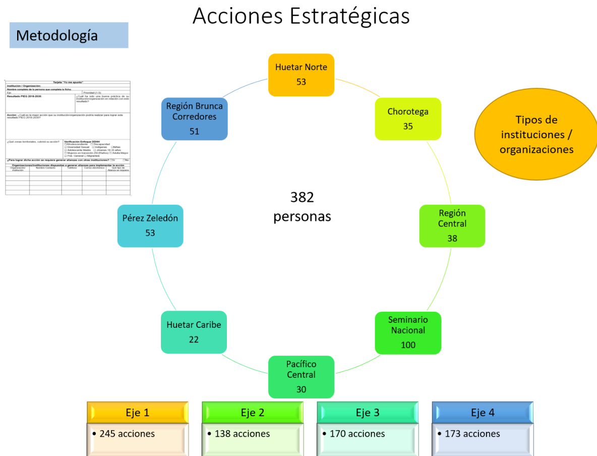
Gráfico 1. Cantidad de acciones estratégicas derivadas de espacios de diálogos nacional y regionales. Primera fase Plan de Acción.

Fuente: Informe Ejecutivo Etapa 2 Proceso de elaboración Plan Acción PIEG. FLACSO. 2018.